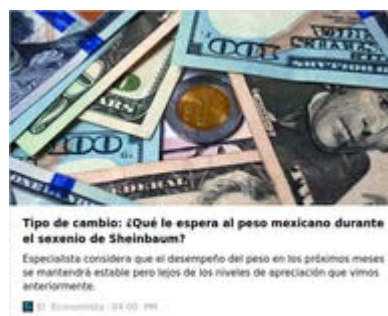
Tipo de cambio: ¿Qué le espera al peso mexicano durante el sexenio de Sheinbaum? Especialista considera que el desempeño del peso en los próximos meses se mantendrá estable pero lejos de los niveles de apreciación que vimos anteriormente. El Economista 04:00 PM

En este entorno el directivo de Blue Whale Markets recomienda una estrategia de inversión defensiva y diversificada para reducir el riesgo. Por una parte, siempre será una buena idea acudir a las inversiones en oro, plata o divisas fuertes como el franco suizo, ya que se trata de activos que brindan estabilidad en tiempos de volatilidad.